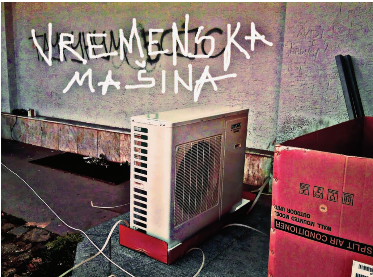
Iz Zvonkovog magacina: Uređaj za hlađenje barikada

Dok sam na televiziji gledao razjarene sugrađane koji su u nekoliko gradova na Kosovu palili srpske prehrambene proizvode, širio sam oči da bih video da se možda na lomači ne nalazi i antologija srpske proze koju smo nedavno preveli na albanski jezik. Ona bi, pretpostavljam, lepo gorela, a ja bih opet bio potresen „pričama o knjigama“ koje sam doživeo poslednjih godina. Radi se o nizu istorija „paljenja“ i „istraga“ knjiga... Kao da je u knjigama bilo skriveno „najveće zlo“ onoga drugog. Ako spalisi i uništiš knjige, spalio si i uništio zlo!